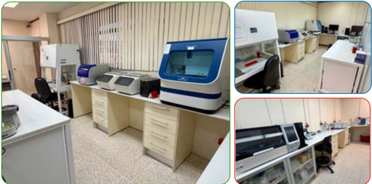
fotografías: Espacio físico del laboratorio y equipamiento

Se acondicionó un espacio dentro de la Sección de Biología Forense del Departamento de Ciencias Forenses del OIJ para crear el laboratorio de análisis de identificación taxonómica de muestras de flora y fauna silvestres a través del método de código de barras genético (Barcoding). Esto implicó ingreso de los equipos y los insumos.