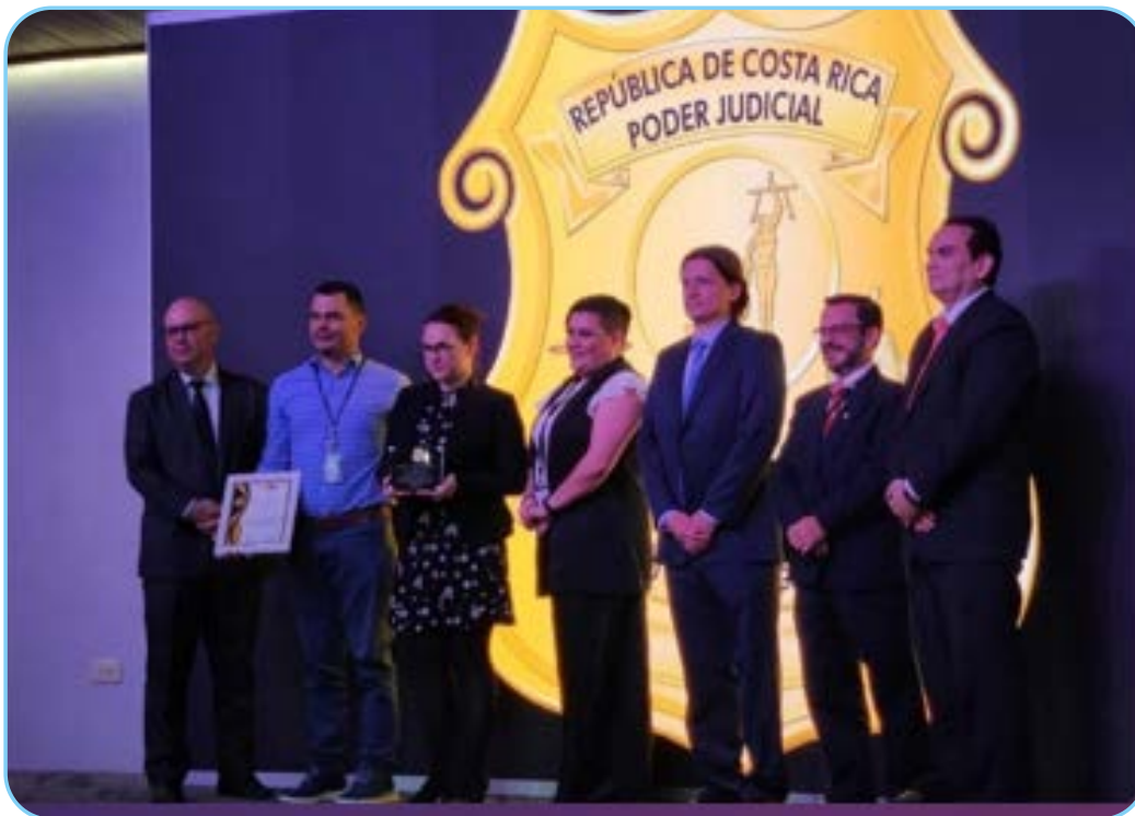
Fuente: Departamento de Ciencias Forenses, fotografía: Premiación a mejor proyecto OIJ 2024

Más allá de lo anterior, el principal beneficio e impacto obtenido consistió en dotar a la administración de justicia de peritajes con mayor nivel de confirmación en el análisis taxonómico.