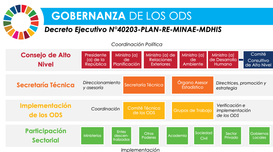
Figura 2. Modelo de Gobernanza de los ODS en Costa Rica, 2021